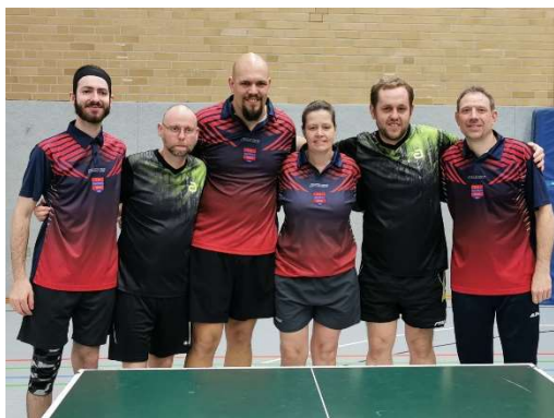
GSV Aachen I - SKN Brno