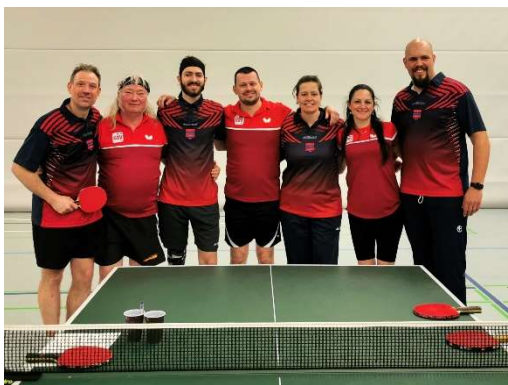
GSV Düsseldorf III – SKN Brno