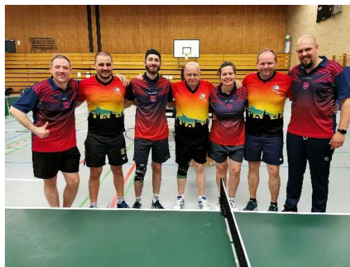
SKN Plzeň – SKN Brno