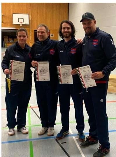
4. místo: SKN Brno