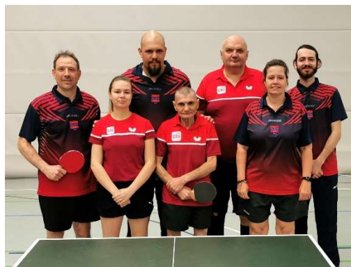
SKN Brno – GSV Düsseldorf II