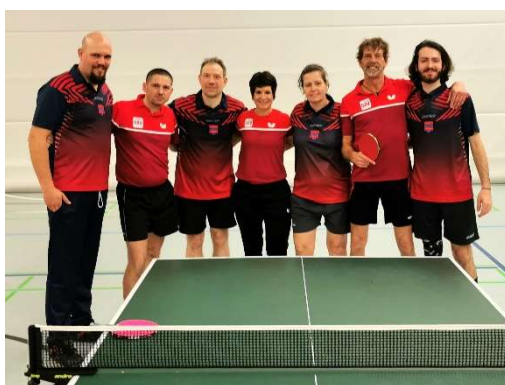
GSV Dusseldorf I – SKN Brno